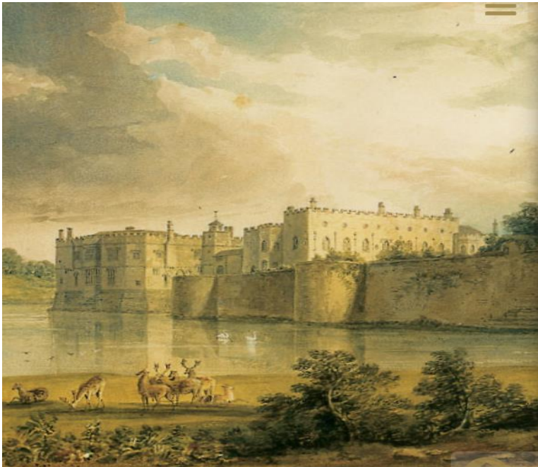
Maison de style Tudor 1793-1821 (tardif)