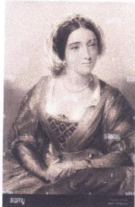
1 Eleanor de Castille