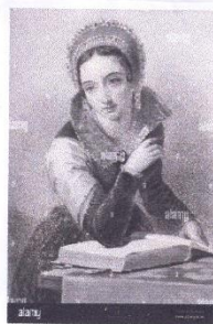
6 Jeanne de Navarre