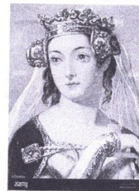
4 Philippa de Hainaut