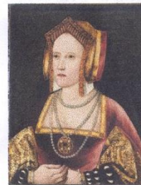
7 Catherine d' Aragon