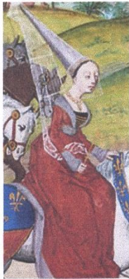
3 Isabelle de France