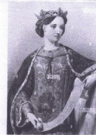
2 Marguerite de France